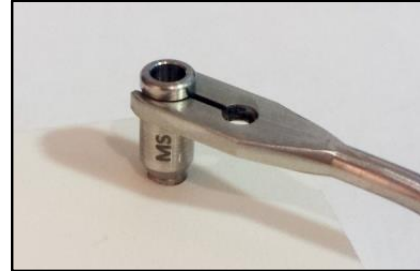
3-Posizionare la guida di centraggio sull'impianto utilizzando la chiave.