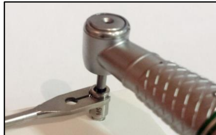
6-Inserire la fresa direttamente nella guida di centraggio con il contrangolo.