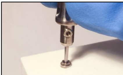
9-inserire il punzone nella vite.