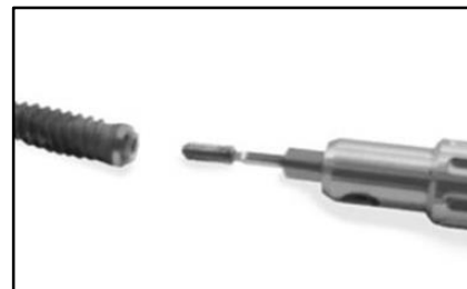
11-Togliere la vite.