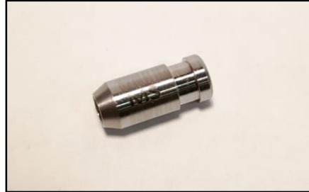
2-Selezione della guida di centraggio in base alla connessione e alla piattaforma.