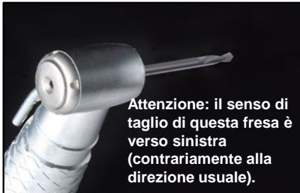
5-Posizionare la fresa nel contrangolo.