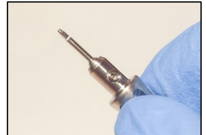
8-Selezione del punzone di estrazione.