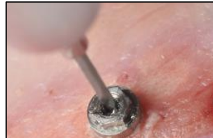
7-Rimuovere la guida e perforare la vite con il contrangolo.